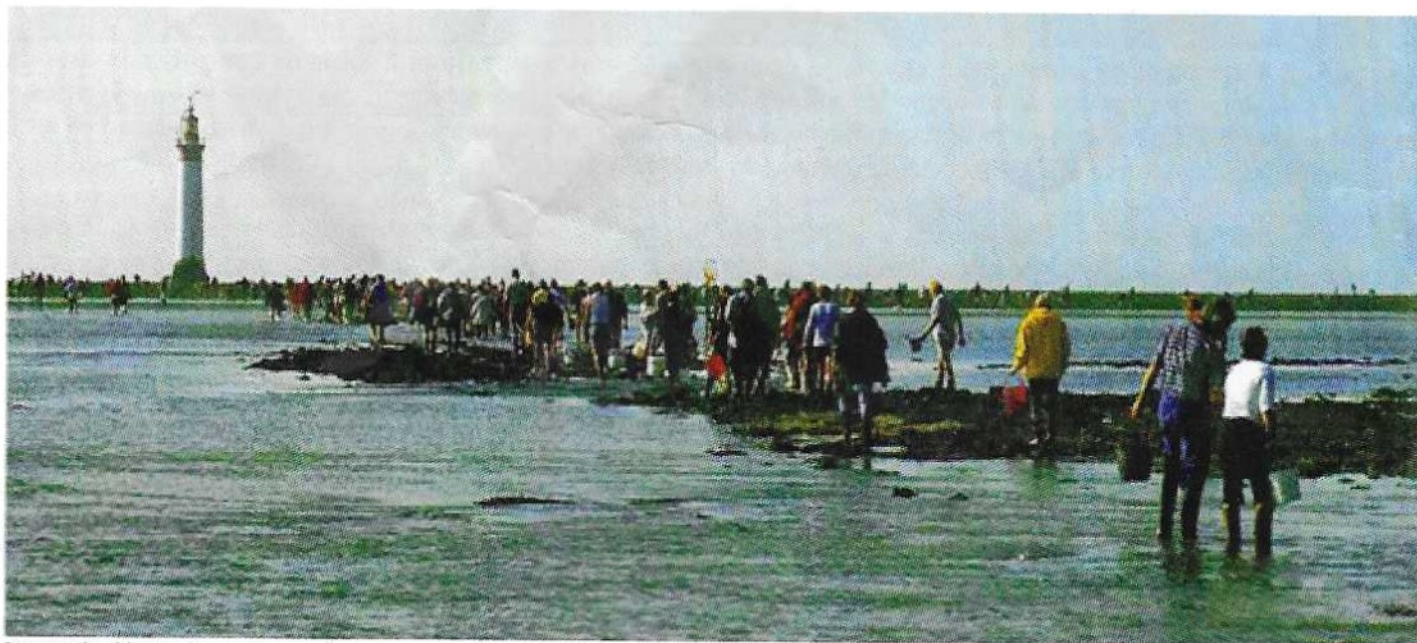
Image de départ des pêcheurs à pied vers le phare de Chauveau, un jour de grande marée durant l'été 2003.