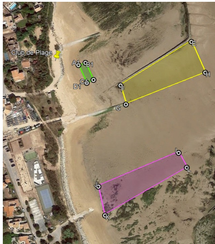
En vert : création d'une Zone de Baignade Surveillée sur la plage du Gros Jonc