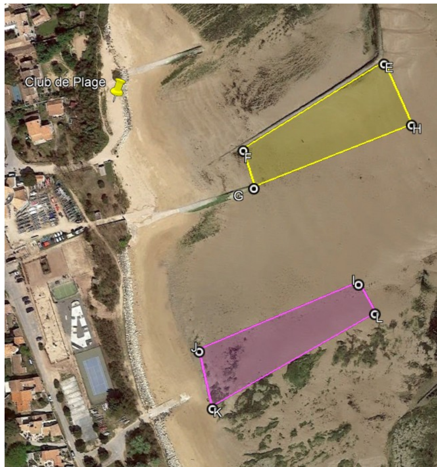
Balisage en vigueur sur la plage du Gros Jonc